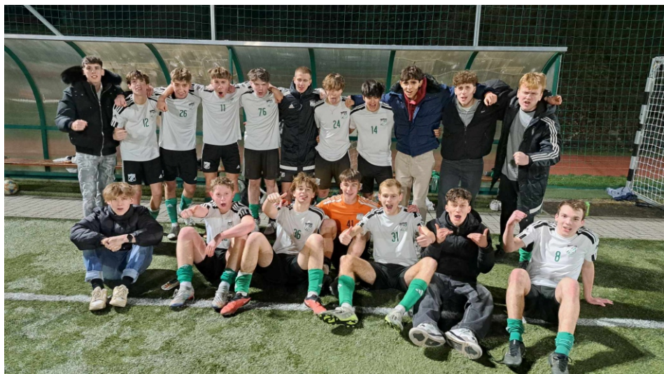
Az Ajka elleni rangadón hátrányból 2–1-re nyertünk.