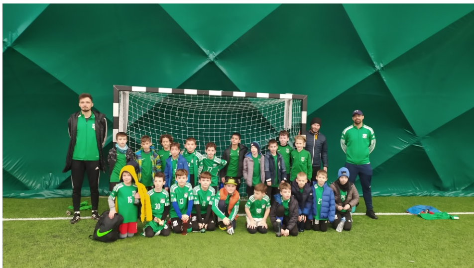
Barátságos mérkőzés a Kelen SC ellen.