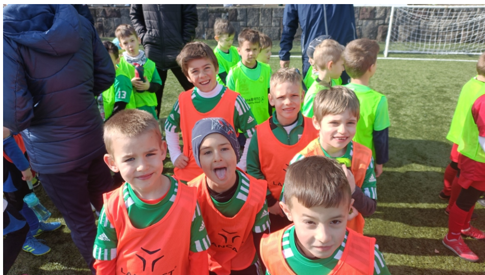
Vidám arcok a Bozsik Fesztivál megnyitóján.