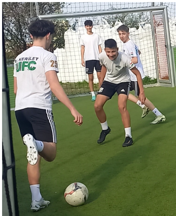
Szeretünk edzés előtt kispályázni a palánkos pályán.