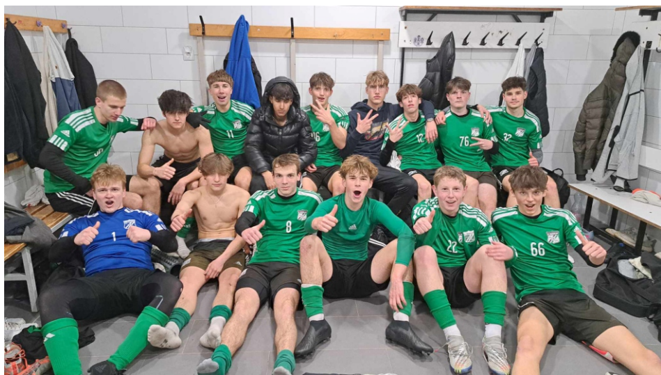
Az ÚTE ellen nagyon jó játékosokkal vettük fel a versenyt, s nyertünk 3–1-re.