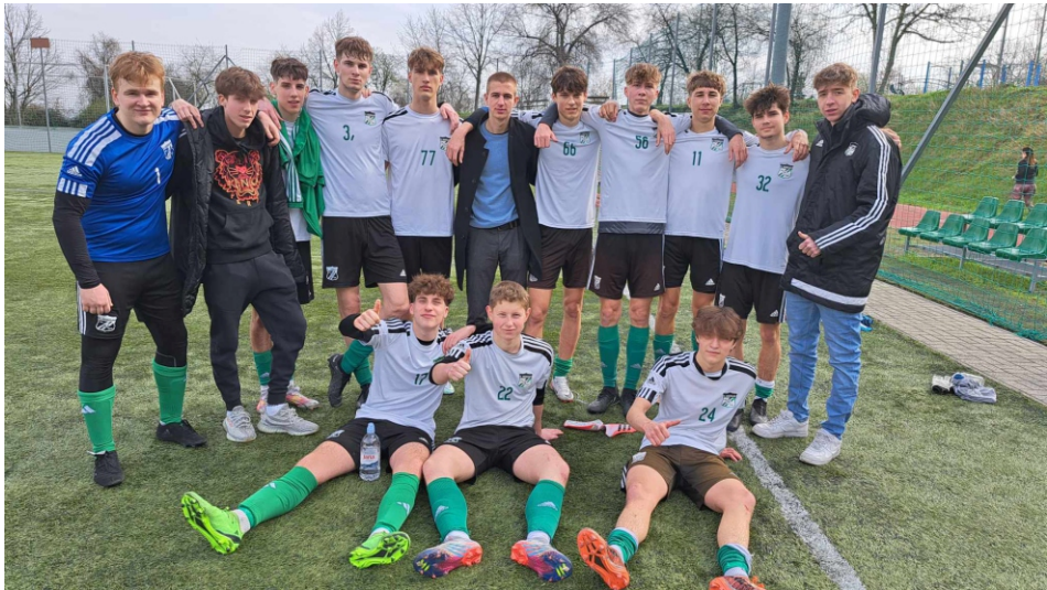
Tíz gólt szereztünk a Kelen SC ellen.