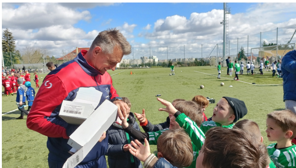
Extra meglepetés - Találkoztunk Mészöly Gézával.