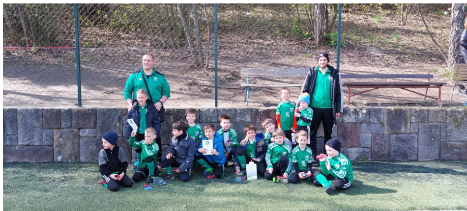
Újra együtt az első tavaszi Bozsikön.