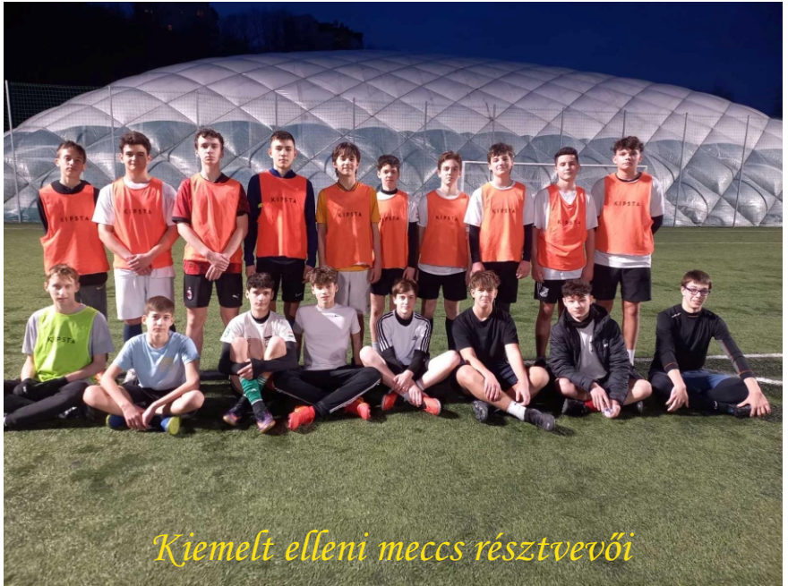
Kiemelt elleni meccs résztvevői