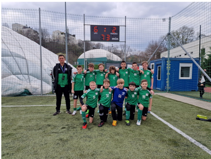
Második csapatunk felemás játékkal aratott magabiztos sikert a Hegyvidék Gerrzo csapata felett hazai pályán.