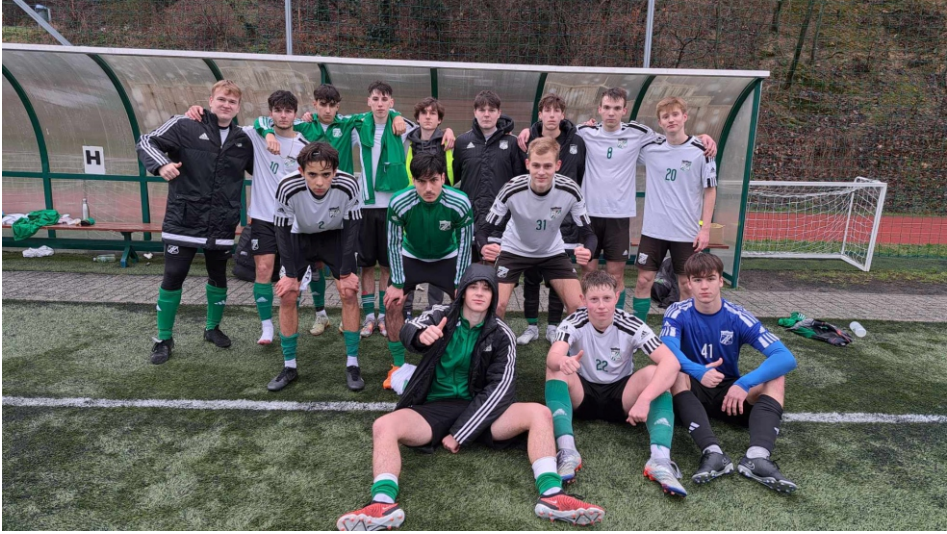
A tavasz első bajnoki meccsén nagyon meggyőző teljesítményt nyújtottunk a Budai FC elleni 4–1-es győzelem során.