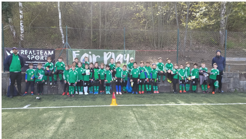
Az első tavaszi Bozsik Fesztiválon.