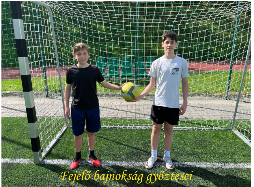
Fejlesztő bajnokság győztesei