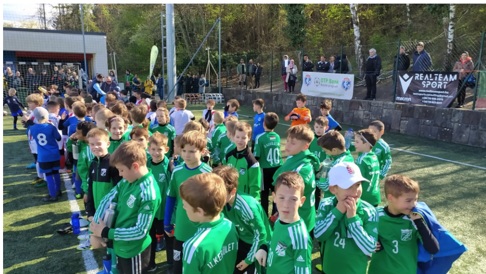
Túlerőben a zöldek, 31 fővel vettünk részt a Bozsik Fesztiválon.