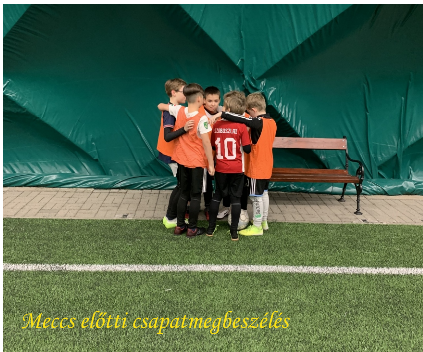
Meccs előtti csapatmegbeszélés