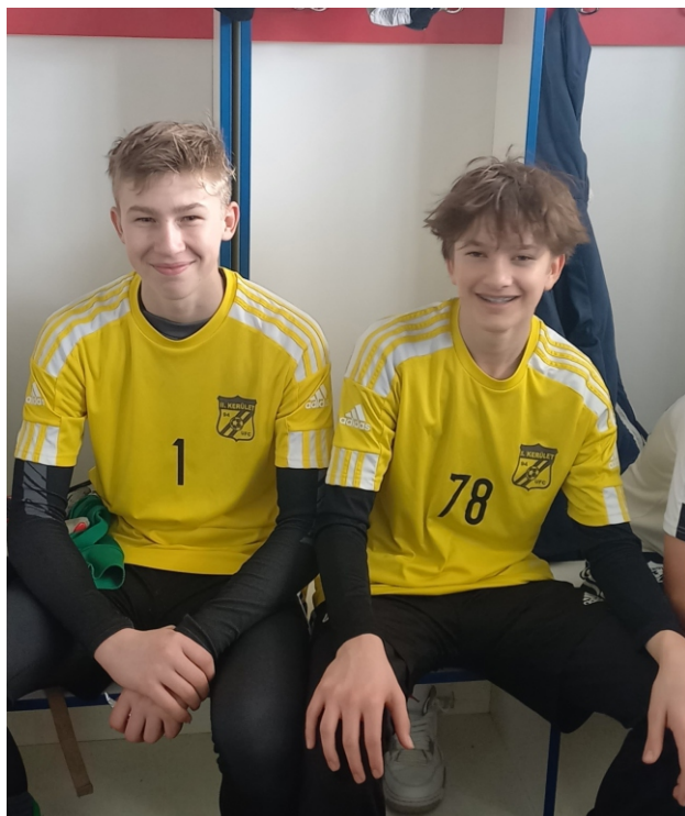
Kiváló kapusaink nagyott nőttek és sokat fejlődtek,