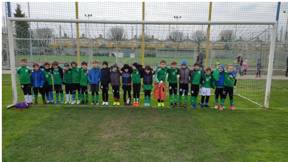
Tele a kapu! BKV Liga első forduló.