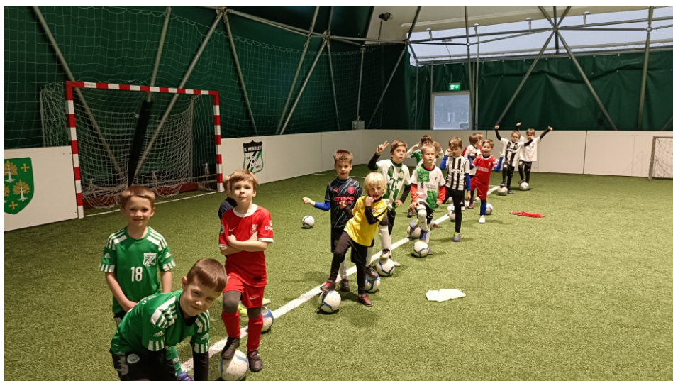
Hangolódás az edzésre.