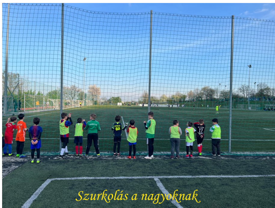
Szurkolás a nagyoknak