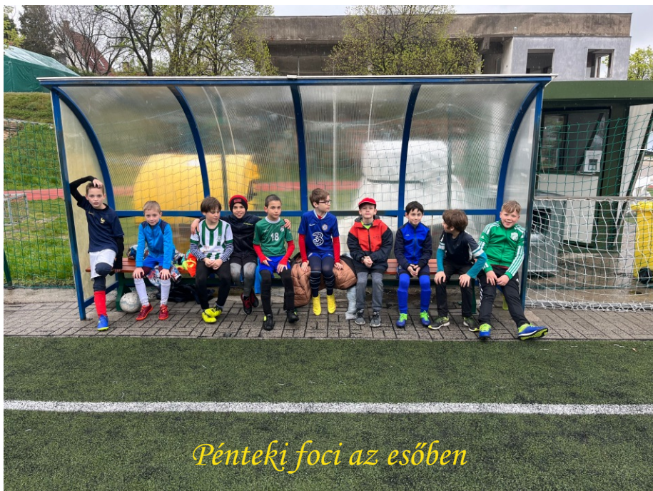
Pénteki foci az esőben