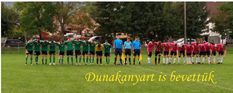
Dunakanyart is bevettük

Számszerűleg kiegyensúlyozott hónapunkon vagyunk túl, sok tanulsággal. Az egyik, hogy fejben dől el. Ha akarunk, küzdünk bizva egymásban és a focival foglalkozunk rengeteg szép pillanatot okozhatunk egymásnak.