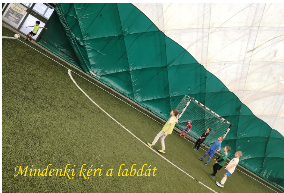
Mindenki kéri a labdát