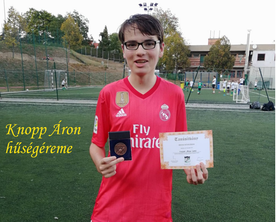
Knopp Áron hűségérme