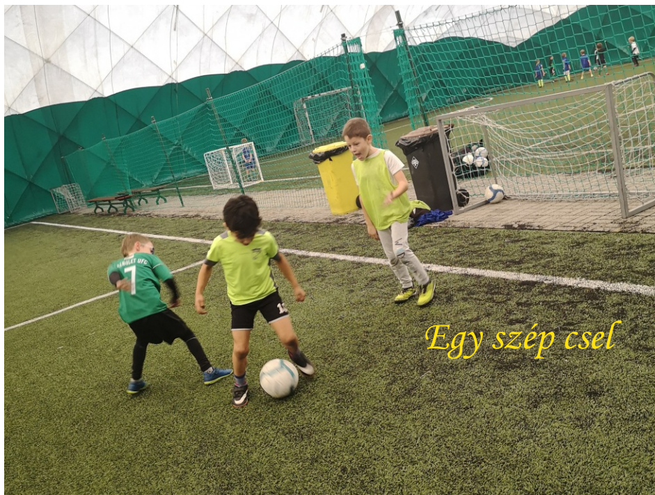
Egy szép csel