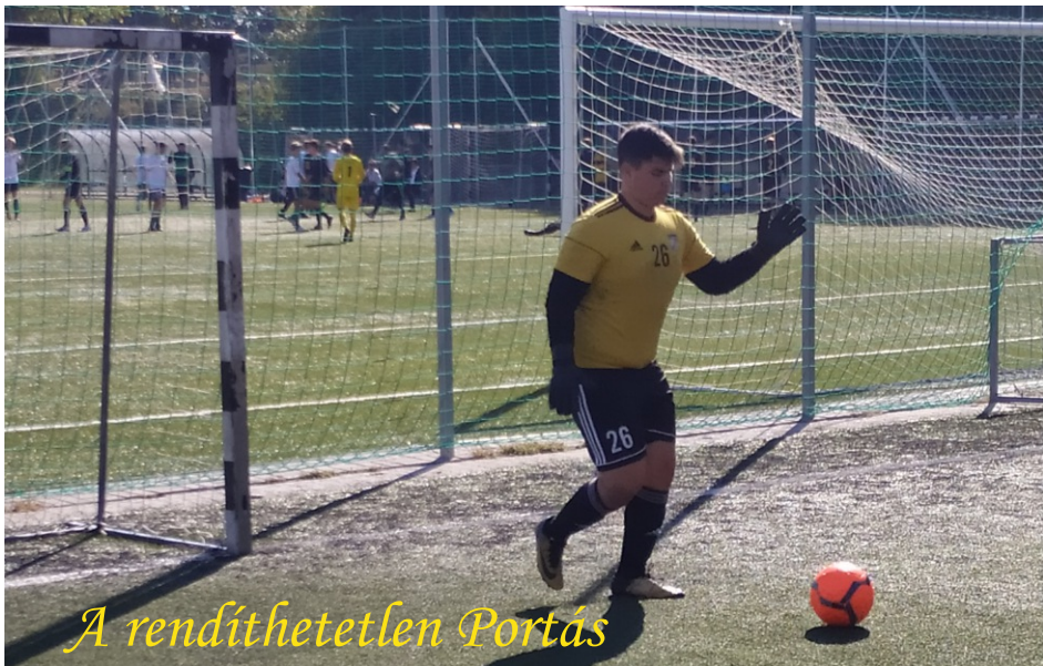
A rendíthetetlen Portás

Számszerűleg kiegyensúlyozott hónapunkon vagyunk túl, sok tanulsággal. Az egyik, hogy fejben dől el. Ha akarunk, küzdünk bizva egymásban és a focival foglalkozunk rengeteg szép pillanatot okozhatunk egymásnak.