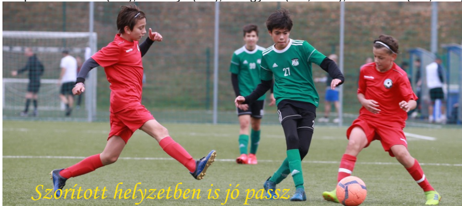
Szorított helyzetben is jó passz