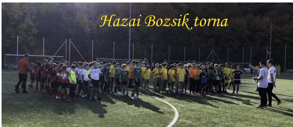
Hazai Bozsik torna

Jövő nyáron a horvátországi Umag városában vesz részt csapatunk nemzetközi tornán, amelyre 14 játékost viszünk, hamarosan az edzőknek el kell dönteniük a nehéz kérdést, hogy mely játékosok kerüljenek be az utazó keretbe.