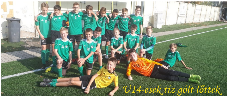
U14-esek tíz gólt lőttek